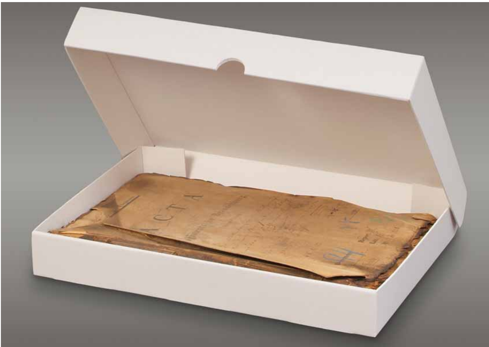
linke Seite unten: SB 33 aus Wellpappe 3,0 mm, kaschiert mit Archivpapier 120 g/m 2 atlantisblau, verklebt unten: SB 34 aus Wellpappe 1,6 mm atlantisblau/weiß